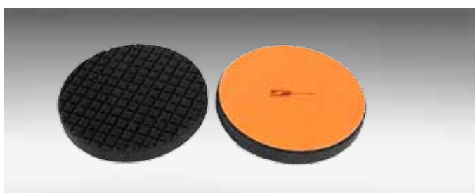
Art. Nr. 0001.0697 (72801) Ø 80 mm Art. Nr. 0001.0698 (72901) Ø 135 mm Disques mousse Boîte à 20 pièces Ø 80 mm / Boîte à 5 pièces Ø 135 mm