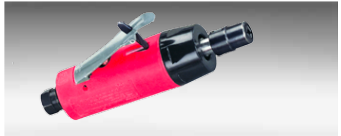
Art. Nr. 0001.0504 (18001) Mini meuleuse courte 25'000 tr/min., Pince 6 mm