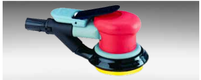
Art. Nr. 0001.0510 (21040) 2,5 mm de course Ø 76 mm (3") Ponceuse excentrique Dynorbital-Spirit® 12'000 tr/min., Spotrepair avec plateau