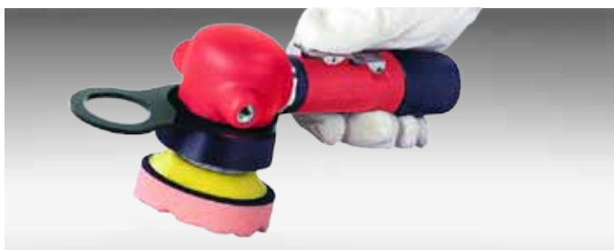
Art. Nr. 0001.0689 (10127) Ø 76 mm (3") Machine à polir Dynabuffer 7000 tr/min. sous pression