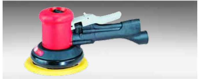
Art. Nr. 0001.0503 (10756) Ø 152 mm (6") Ponceuse double action DynaLocke®, excentrique et orbital 12'000 tr/min. adaptateur incl., sans plateau suppl. de prix pour raccordement Naveca