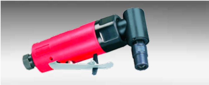
Art. Nr. 0001.0505 (18011) Mini meuleuse à angle droit 20'000 tr/min., Pince 6 mm