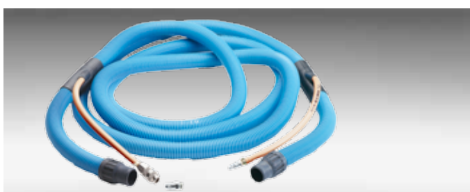
Art. Nr. 0001.0586 (B7049.0000.1) Tuyaux d'aspiration 5 m approprié à l'aspirateur FESTOOL