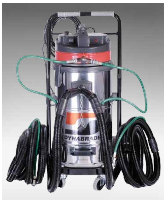
Art. Nr. 0001.0691 (61306) Système d'aspiration portable double raccordement pour tuyaux avec panier pratique et 2 supports 6 m de tuyau, 36 litres, 1400 Watt