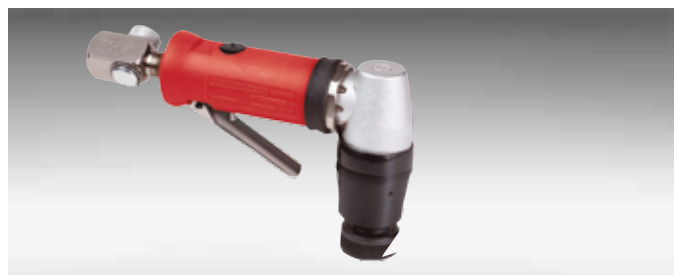
Art. Nr. 0001.0500 (10207) Mini ponceuse orbital à angle droit 12'000 tr/min., 298 W