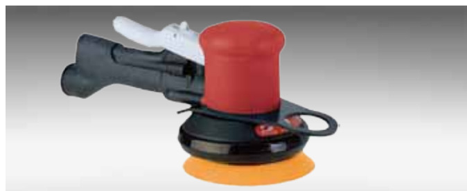
Art. Nr. 0001.0696 (10746) Ø 127 mm (5") Machine à polir Dynabuffer 5000 tr/min. sous pression