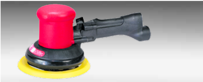
Art. Nr. 0001.0501 (10722) 5 mm de course Art. Nr. 0001.0502 (10734) 10 mm de course Ø 152 mm (6") Ponceuse Dynorbital® à deux mains 12'000 tr/min. avec anneau à brosse., sans plateau suppl. de prix pour raccordement Naveca