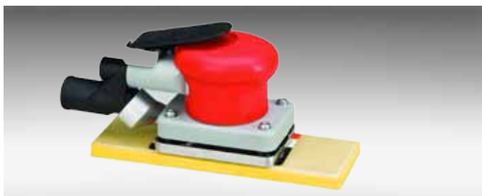
Art. Nr. 0001.0773 (10292-1) Art. Nr. 0001.0796 (10292-2) raccordement Naveca incl. 70 mm x 198 mm (2-3/4" x 7-3/4") Dynabug® ponceuse orbital avec plateau auto-agrippant