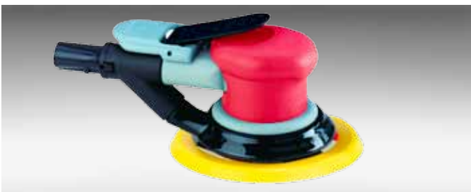
Art. Nr. 0001.0511 (21056) 2,5 mm de course Art. Nr. 0001.0509 (21036) 5 mm de course Art. Nr. 0001.0508 (21016) 10 mm de course Ø 152 mm (6") Dynorbital-Spirit® Ponceuse excentrique 12'000 tr/min. avec anneau à brosse, sans plateau raccordement Naveca inclusive