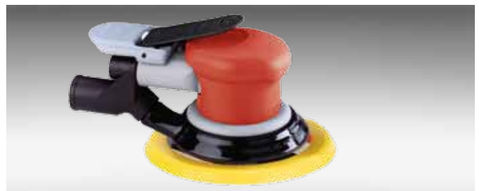
Art. Nr. 0001.0575 (21059) 2,5 mm de course Art. Nr. 0001.0576 (21039) 5 mm de course Art. Nr. 0001.0577 (21019) 10 mm de course Ø 152 mm (6") Dynorbital-Spirit® Ponceuse excentrique 12'000 tr/min., anneau à brosse, sans plateau raccordement tuyau de 28 mm; 32 mm sur demande