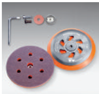
Plato aerodinámico T7207.0000.1 extra blando incl. adaptador universal con forma de «estrella» 5/16" + M8

sia Abrasives Industries AG CH-8501 Frauenfeld/Switzerland www.sia-abrasives.com sia.ch@sia-abrasives.com