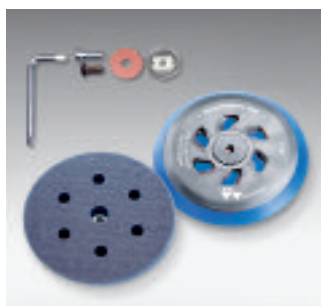
Plato aerodinámico T7206.0000.1 blando incl. adaptador universal con forma de «estrella» 5/16" + M8