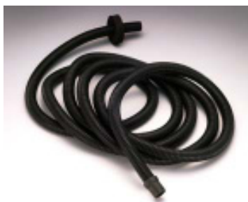
Tubo de aspiración T8592.0000.1