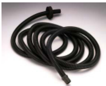
Tubo per tampone aspirato T8592.0000.1