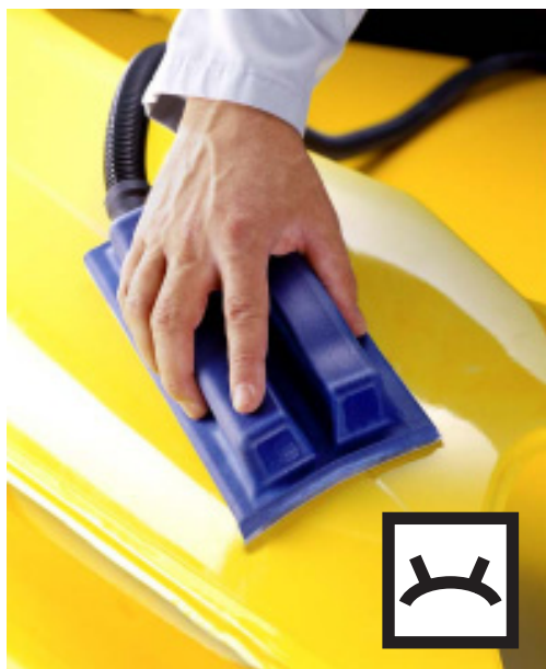
Levigatura su pezzi convessi